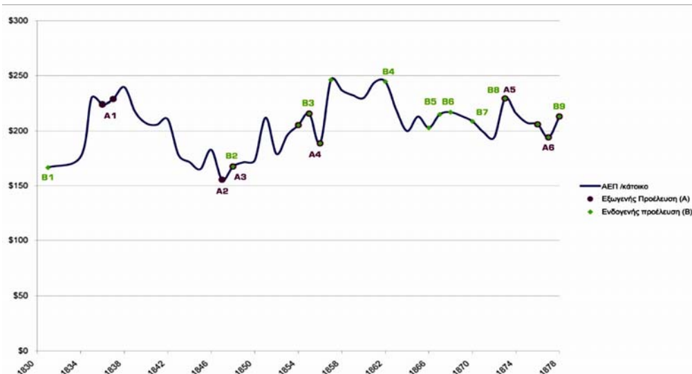
Διάγραμμα 15.4.1 Αρνητικά επεισόδια στην ελληνική οικονομία και κοινωνία: 1831-1878